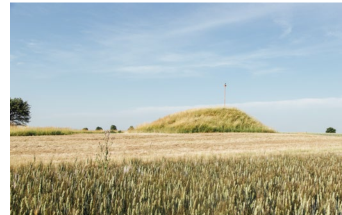
HÜGELGRÄBER AUS DER HALLSTATTZEIT