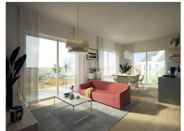
WOHNKÜCHE MIT GROSSZÜGIGEN FENSTERFRONTEN (BAUTEIL 3)

Konträr zu neuen Siedlungen am Dorfrand entsteht hier ein neuer Lebensraum im Dorfkern. Dieser sorgt für frischen Wind und verdichtet auf behutsame Weise die Dorflandschaft.