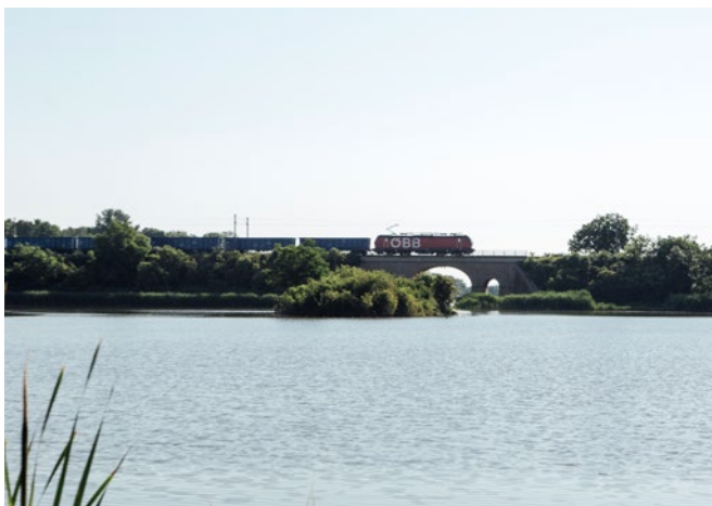
ZÜGIG UNTERWEGS – AUF DEN STRECKEN DER KFN – SEIT 1849

Ein Tagesausflug über die Grenze lohnt sich. Die tschechische Kleinstadt Breclav hat Sehenswertes im Repertoire: Neben dem Schloss, der Schlossbrauerei und vielen netten Gaststätten sind auch die Synagoge, der Apollotempel oder die moderne Wenzelskirche einen Besuch wert und erzählen von Tschechiens bewegter Geschichte.