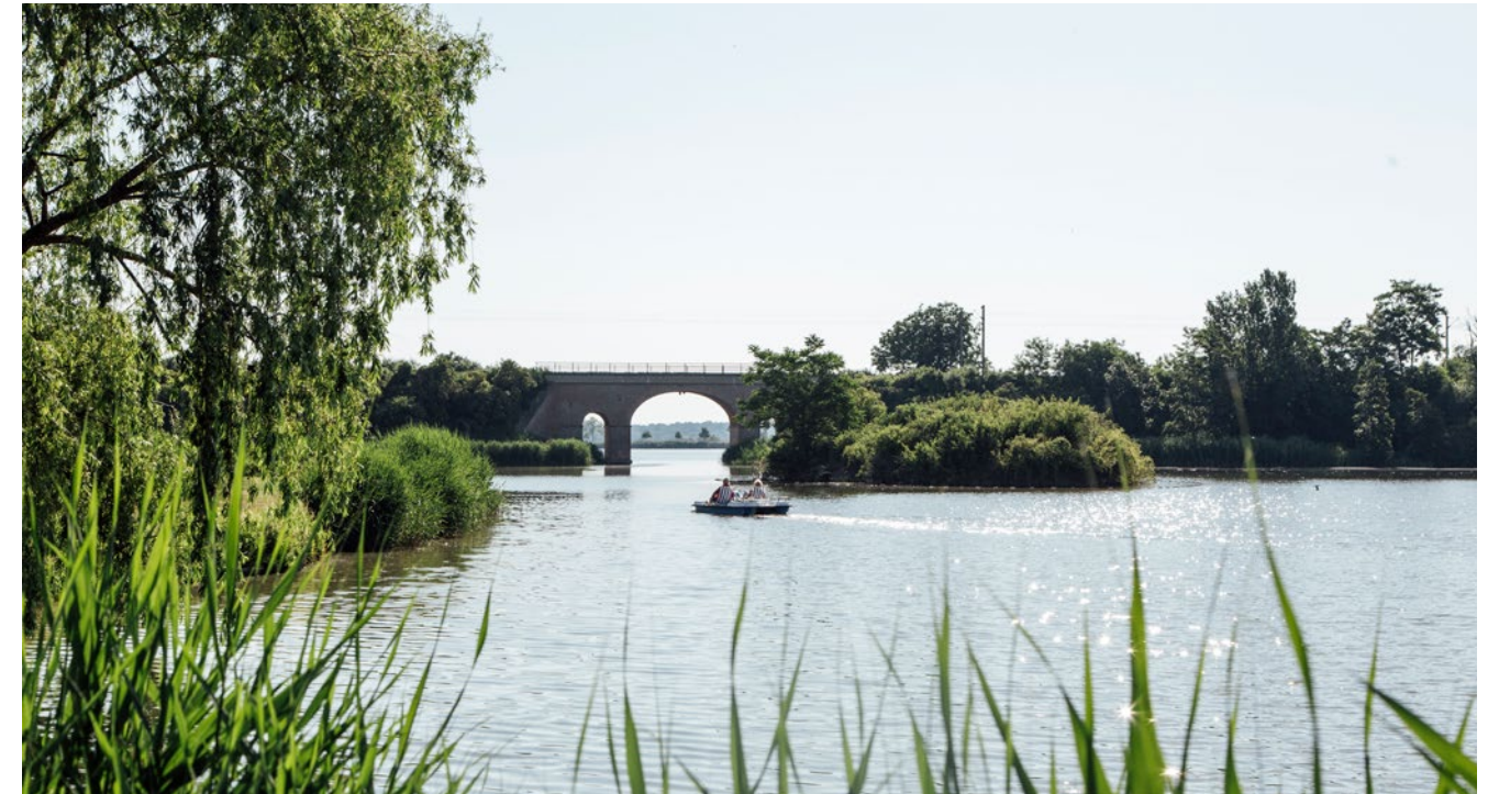
DER BERNHARDSTHALER LANDSCHAFTSTEICH, AUCH „OASE DES WEINVIERTELS“ GENANNT, IST DIE GRÖSSTE WASSERFLÄCHE DES WEINVIERTELS. ER GEHÖRT ZUM LETZTEN REST EINER EINST GROSSEN TEICHLANDSCHAFT UND WIRD VON EINER EISENBAHN-ZIEGELBRÜCKE GETEILT. DIESE WURDE 1839 VON KARL RITTER VON GHEGA ERRICHTET.